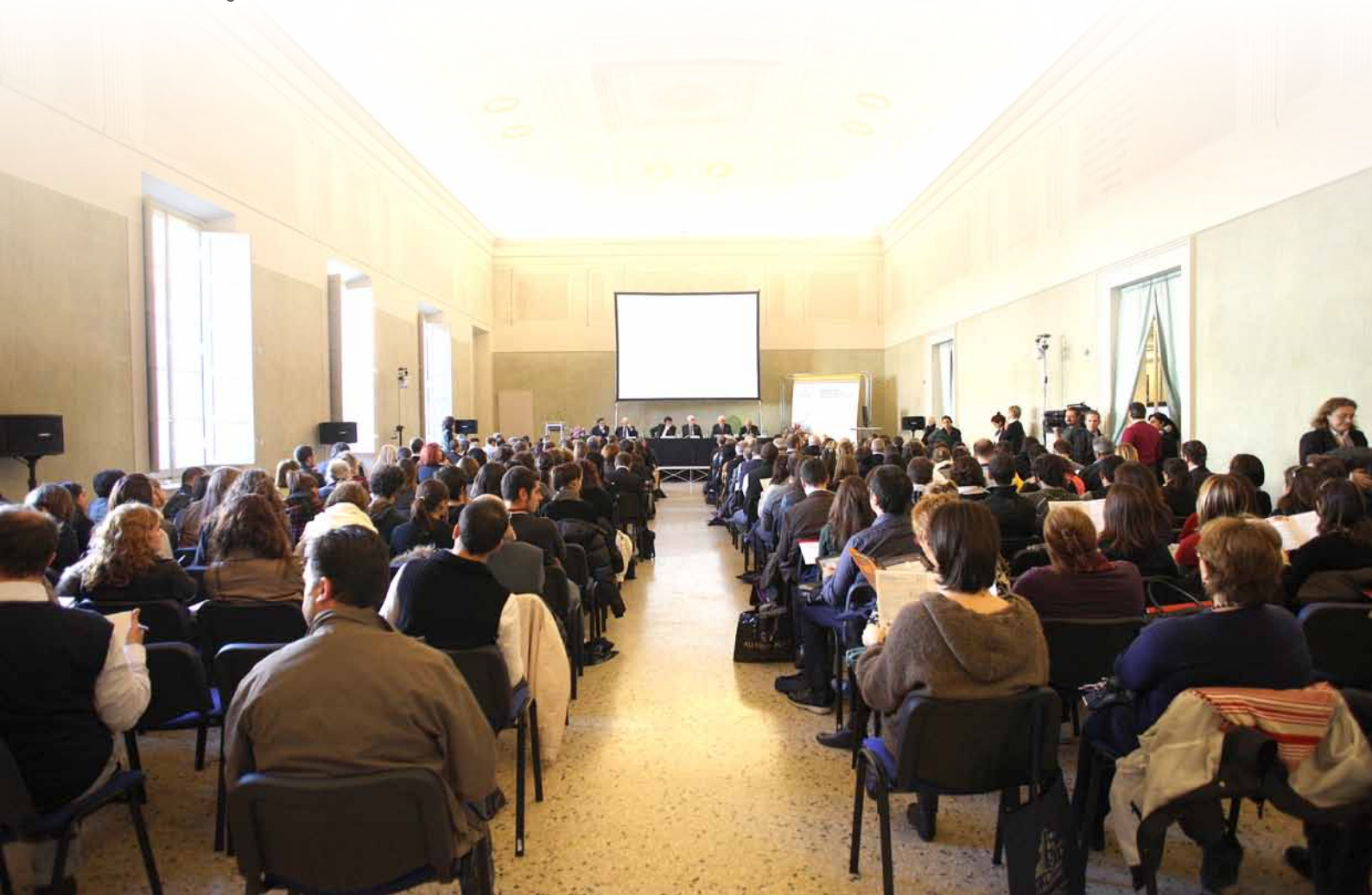
Nella pagina a sinistra, l'entrata del Real Collegio durante la sesta edizione di Lu.Be.C. In questa pagina, dall'alto, Stefano Baccelli, presidente della Provincia di Lucca, e Mauro Favilla, sindaco del Comune di Lucca. Sotto, un momento del convegno di Lu.Be.C.