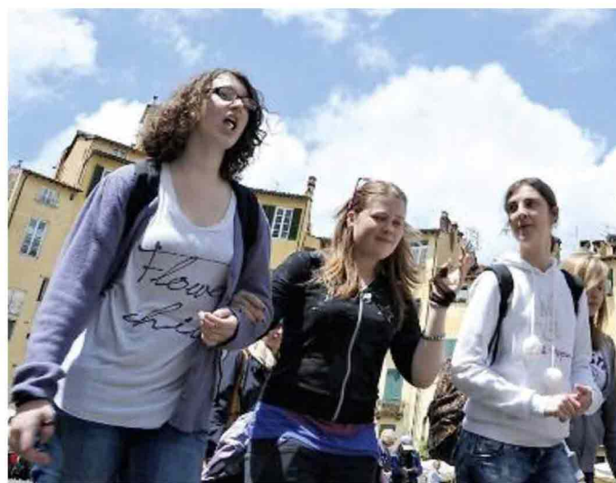
DIBATTITO Ricchezza o problema? Il turismo ancora divide

tessuto sociale ancora integro con numerosi residenti che abitano in città. Cominciamo però a intravedere alcune caratteristiche che sono comuni a tutte le città italiane d'arte come per esempio il calo dei residenti, l'aumento degli appartamenti vocati a destinazione turistica, la chiusura dei negozi