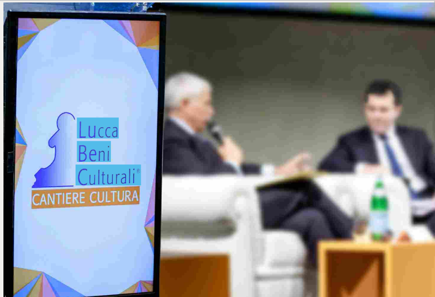
Al via la XVI edizione di LuBeC: quest'anno sarà possibile seguirla in presenza e online

REALIZZIAMO I TUOI DESIDERI, DANAÉ PROJECT