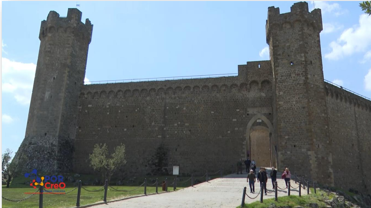
Fortezza di Montalcino (SI)