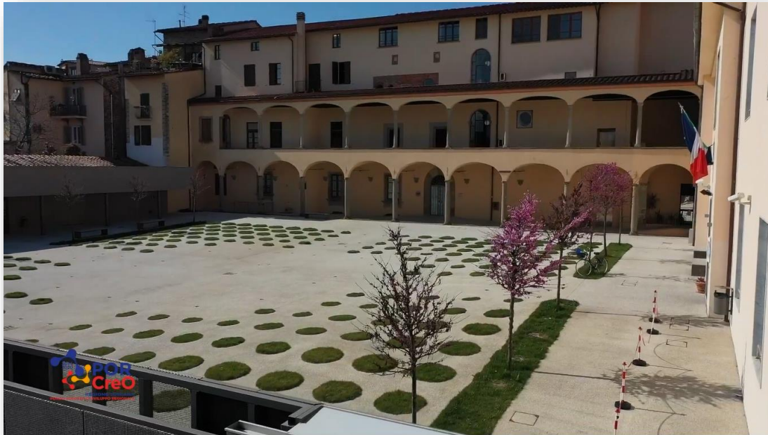
Sistema museale di Palazzo Fabroni a Pistoia