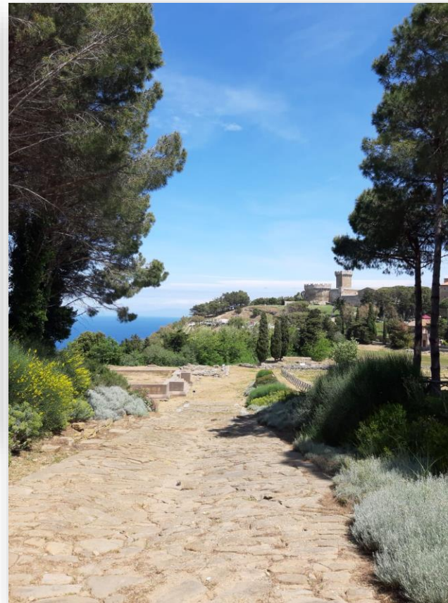
Museo Archeologico del Territorio di Populonia a Piombino (LI)