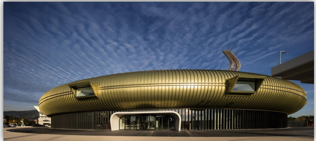
Centro Luigi Pecci di Prato