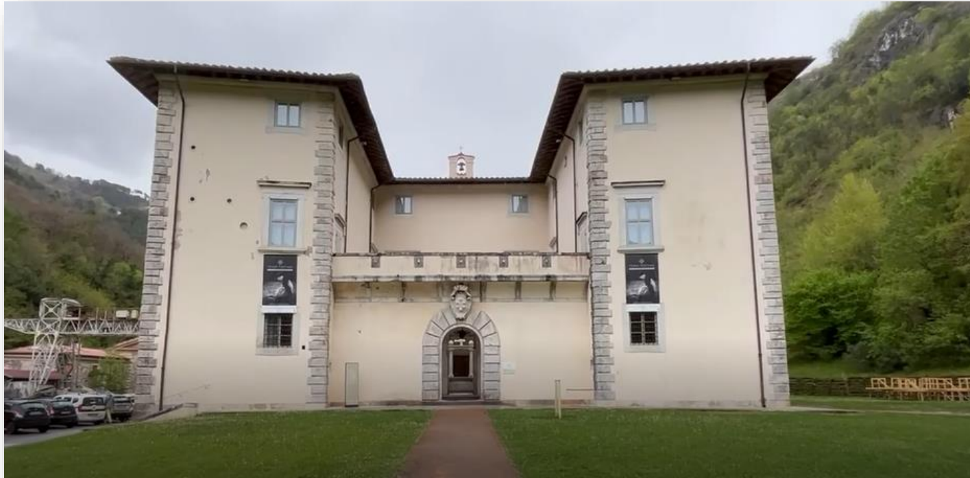
Villa Medicea di Seravezza (LU)