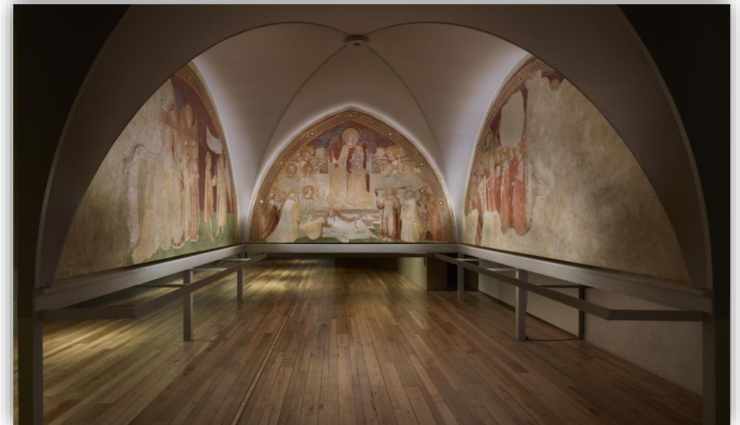
Complesso museale Santa Maria della Scala di Siena