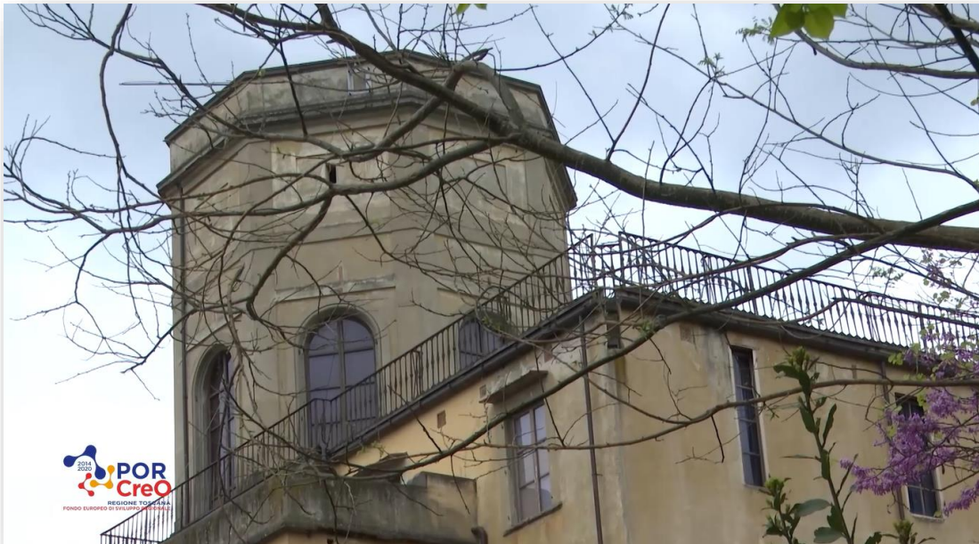
Museo di storia naturale di Firenze, Complesso la Specola