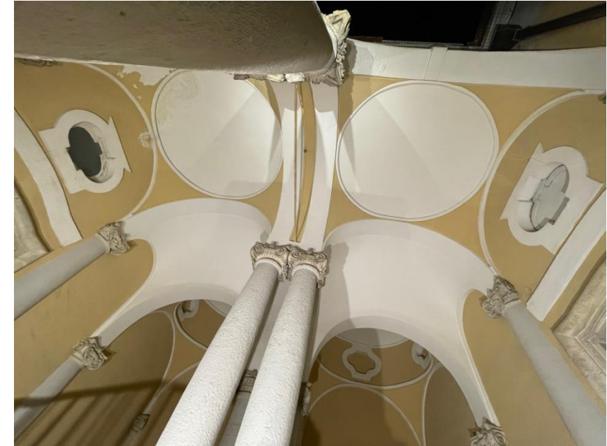
Particolare volte a catino zona corte