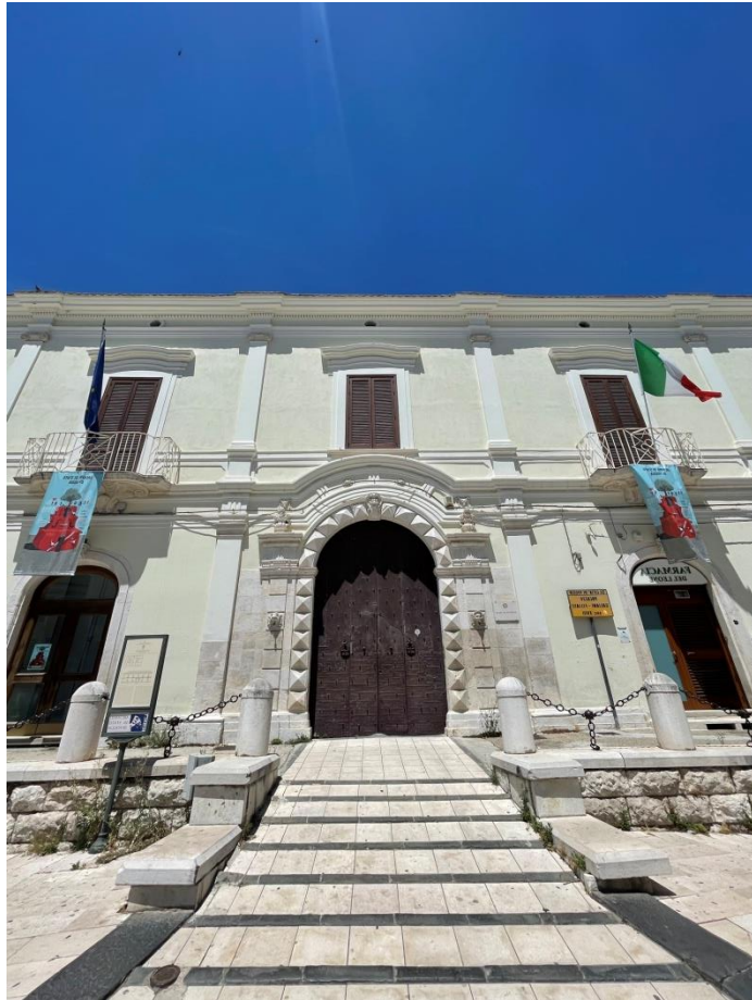
Il portale dell'ingresso principale