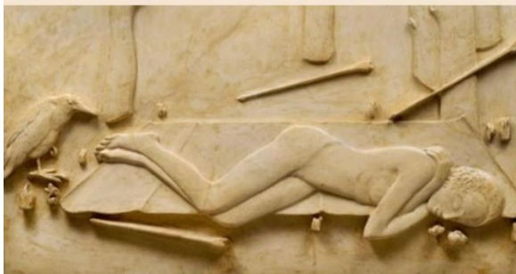
▲ La dormiente, bassorilievo in gesso, 1924 di Felice Casorati, comprata dal Mart da Sperone