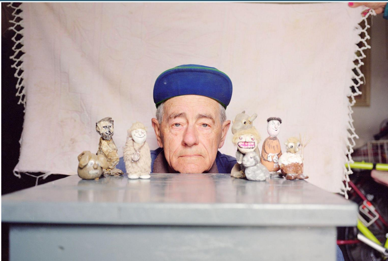
In cerca della retta via, Stefano Azario Fotografie e corto, Lunigiana Land Art