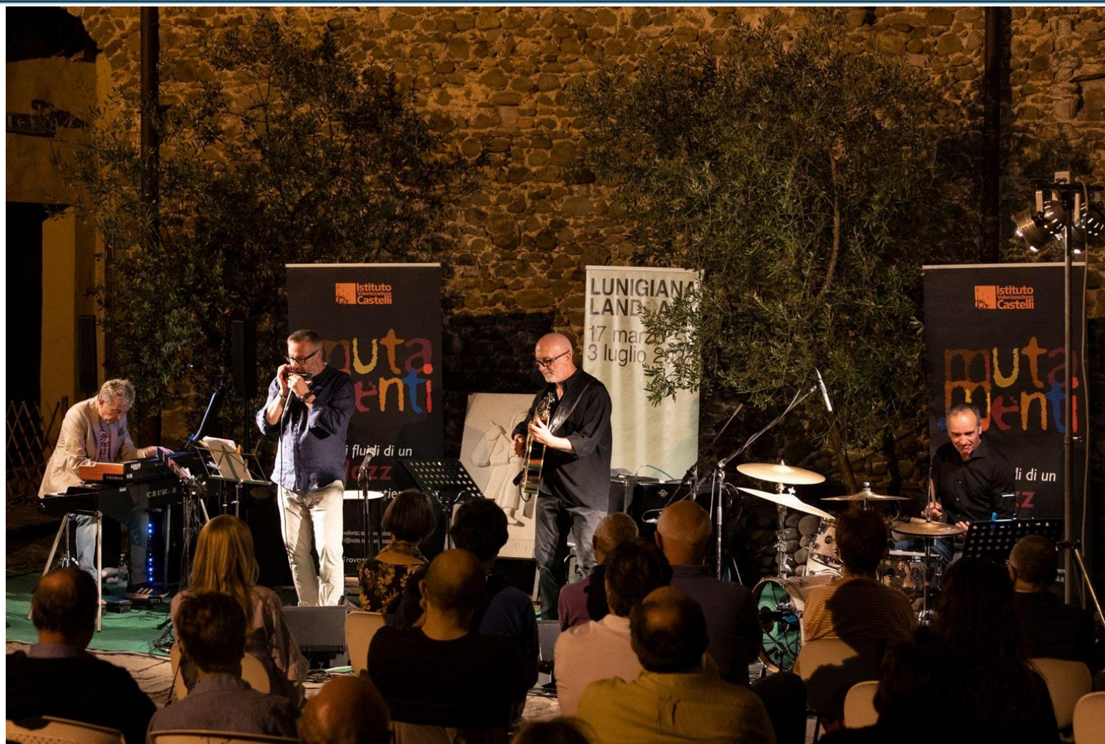
Chromakeys, Istituto Valorizzazione Castelli Concerto jazz in castello, Lunigiana Land Art