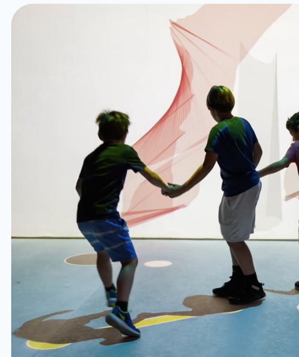
Milano, Museo Nazionale della Scienza e della Tecnologia Leonardo da Vinci. Mostra Le fiabe sono vere .