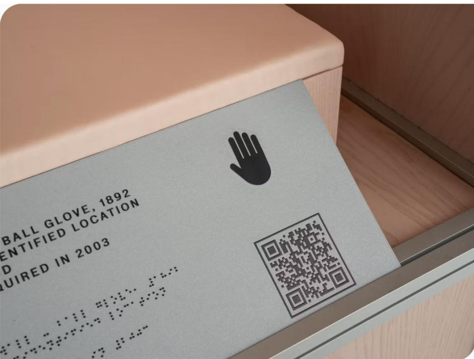
Roma, Museo delle Civiltà. Mostra Le fiabe sono vere . QR code interattivo "ascolta, esplora e conosci". Foto di Pierfrancesco Celada / Gramma Studio