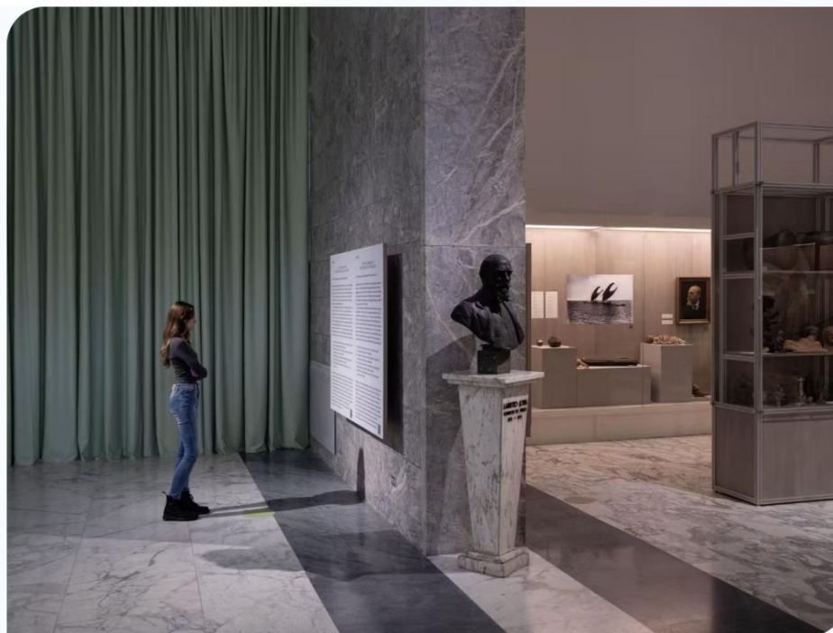
Roma, Museo delle Civiltà. Mostra Le fiabe sono vere . Una sala.